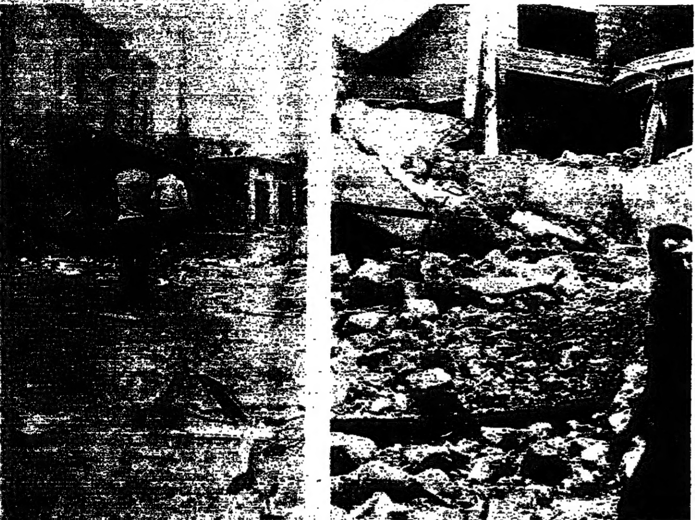
الدمار الذي خلفه العدوان الإسرائيلي في كفرشوبا امين